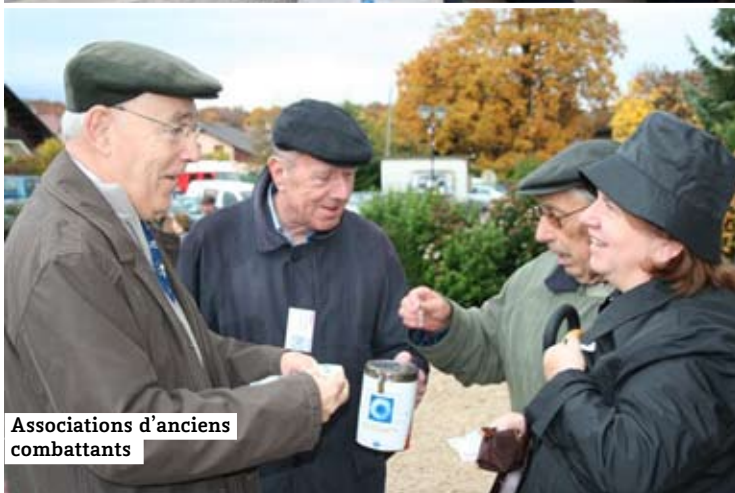
Associations d'anciens combattants