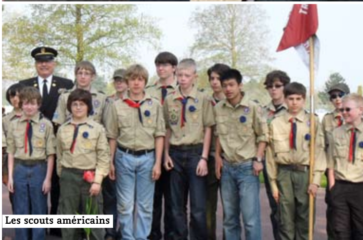
Les scouts américains

Et si vous souteniez le Bleuet de France ?