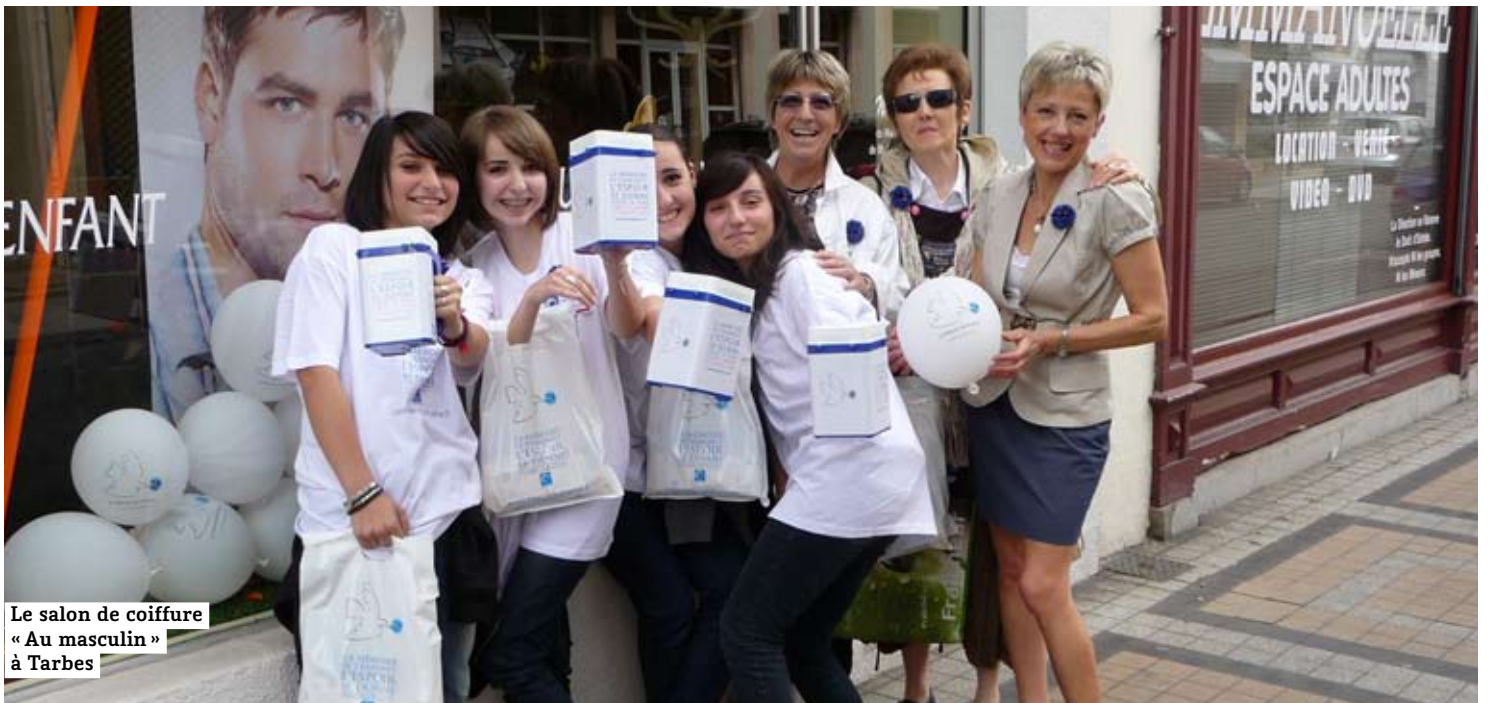
Le salon de coiffure « Au masculin » à Tarbes